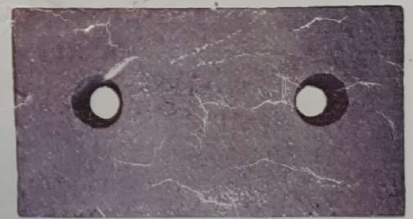
روی سندانى وزن ۲۱ کیلوگرم