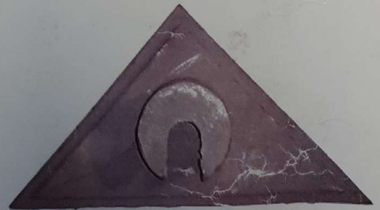
مثلثی نافی دار وزن ۱۰ کیلو گرم