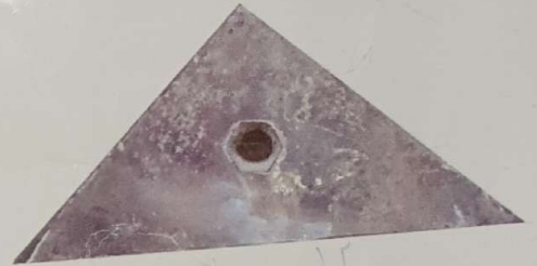
مثلثی وزن ۹,۵ کیلو گرم