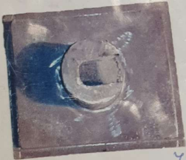
نافی دار ۲۵-۲۵ وزن ۲۳ کیلو گرم