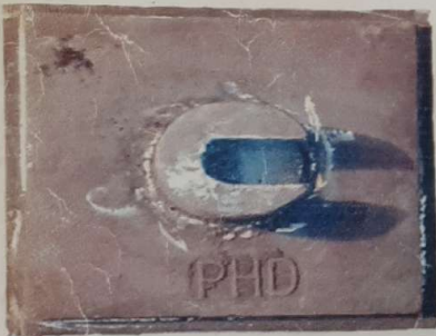
نافی ۲۵-۲۰ وزن ۱۷,۵ کیلو گرم