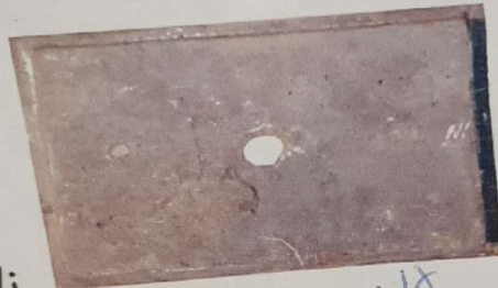
کاشی ۲۵-۲۰ تو سوراخ وزن ۱۶ کیلوگرم