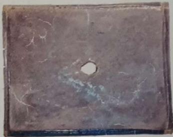
کاشی ۲۵-۲۵ تک سوراخ وزن ۲۱ کیلوگرم